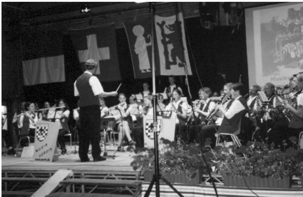
Der Musikverein bei einem seiner drei Konzerte auf der Hauptbühne im Festsaal. Normalerweise wird der Raum als Omnibus Garage der Stadtwerke genutzt, doch davon war Dank der besonderen Dekoration und einiger Umbaumaßnahmen wahrlich nichts mehr zu spüren.

Der Sonntag stand ganz im Zeichen des Wettspiels der neun Vereine aus dem Untergäu. Experten und Publikum hörten interessiert den niveaureichen Beiträgen zu, die dann beurteilt wurden. Während der Mittagspause unterhielt der Musikverein die Teilnehmer mit einem Mittagskonzert.