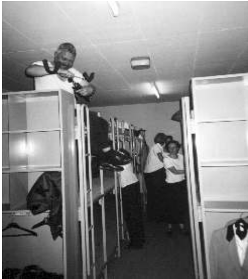
Unser Schlafdomizil: einer der Wangener Luftschutzbunker, mit 1m dicken Decken und Wänden. Aber einem sehr gemütlichen Aufenthaltsraum...

Auf große Reise ging es am Christi-Himmelfahrts-Wochenende für den Musikverein Traben-Trarbach. Anlässlich der 68. Untergäuer Kreismusiktage hatte uns die Musikgesellschaft Wangen als Gastverein in die Schweiz eingeladen.