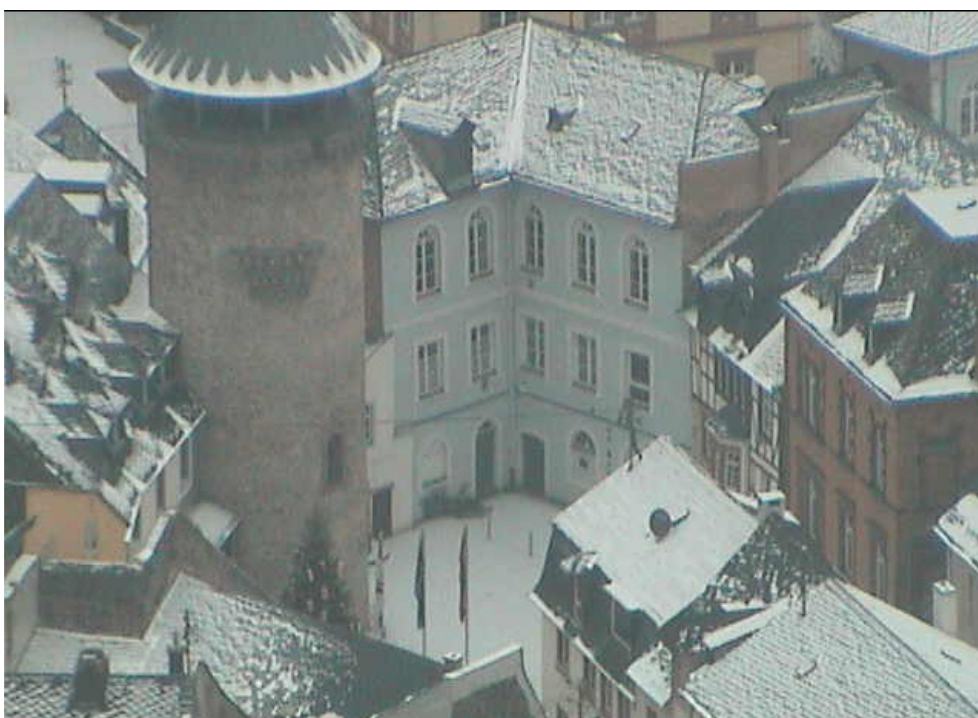
Bild vom Stadtturm von der Webcam auf www.traben-trarbach.de