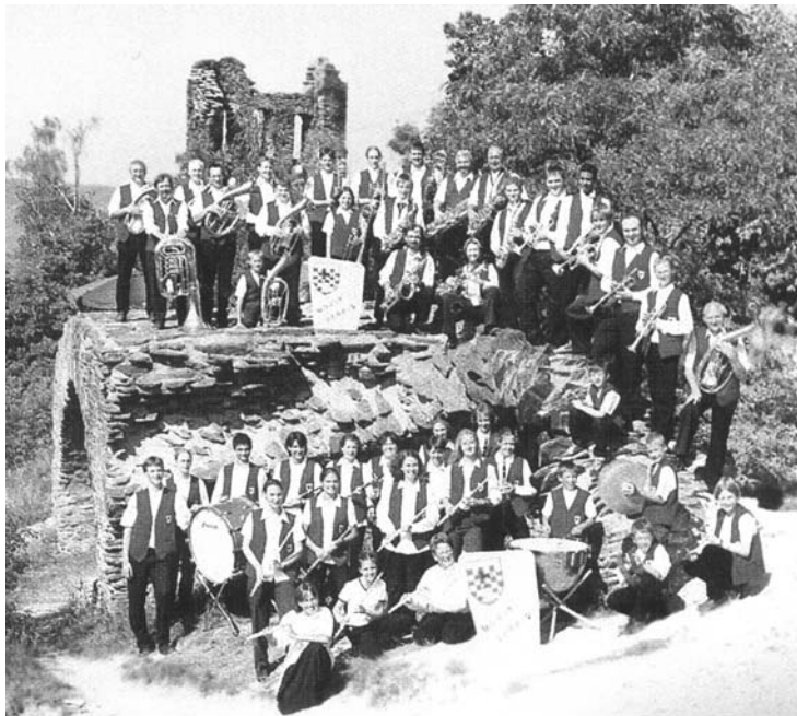
Der Musikverein 1999

Vereinszeitung des Musikvereins Traben-Trarbach für alle Mitglieder