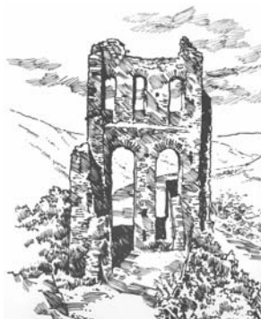
Unser neues offizielles Zeichen für den Schriftverkehr